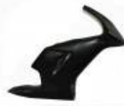
112.460.00 CARENA VETRORESINA MIDI RRZ-RXM