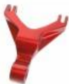
112.223.55 PROLINK MIDI RRZ-3