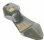
112.459.14 SELLA VETRORESINA MIDI RRZ-3