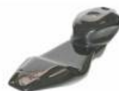
112.459.23 SELLA ABS MIDI RR-MIX NERA