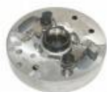
143.555.001 ROTORE VOLANO IDM D.90 (gr. 345) POLINI