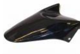
112.455.10 PARAFANGO POSTERIORE ABS