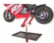
112.485.00 CAVALLETTO PORTA-MOTO OFFICINA (CON ATTACCO PEDANE+ATTACCO FORCELLONE)