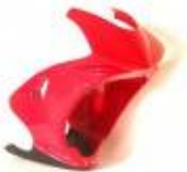
112.460.21 CARENA ABS ROSSA MIDI RR-MIX / MINI RX-X3 112.460.23 CARENA ABS NERA MIDI RR-MIX / MINI RX-X3 112.460.25 CARENA ABS NERO OPACO MIDI RR-MIX / MINI RX-X3