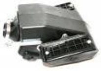
112.393.10 AIR BOX PLK MIDI RRZ 2008-2010