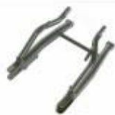
112.223.65 FORCELLONE MIDI RRZ-3