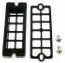
112.393.20 GRIGLIA + COPERCHIO GRIGLIA AIR BOX PLK