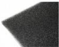
112.393.22 FOGLIO SPUGNA PER AIR BOX PLK (240x300 mm.)