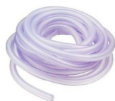
112.351.01 TUBO BENZINA TRASPARENTE PER BENZINA VERDE CONF. 1 MT.