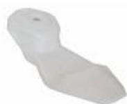
112.459.20 SELLA ABS MIDI RR-MIX BIANCA