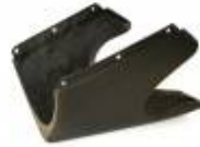
112.460.16 MEZZA CARENA INFERIORE VETRORESINA MIDI RRZ - RXM