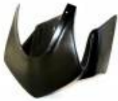
112.460.12 MEZZA CARENA SUPERIORE VETRORESINA MIDI RRZ - RXM