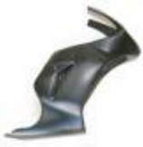
112.460.03 CARENA VETRORESINA MIDI RRZ-3