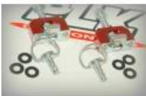
112.252.10 KIT ATTACCHI RAPIDI CARENA ABS MIDI RR MIX /MINI RX 112.252.20 KIT ATTACCHI RAPIDI CARENA VETRORESINA MIDI RRZ-RXM/MINI RXZ