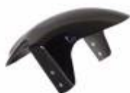
112.453.10 PARAFANGO ANTERIORE VETRORESINA