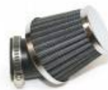
112.400.00 FILTRO ARIA IN METALLO D.35 GRANDE 45°