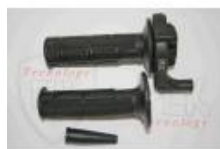
112.327.10 COMANDO GAS RAPIDO PLK