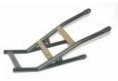
112.223.70 ARCHETTO REGGISELLA IN ALLUMINIO MIDI RRZ-3