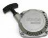
143.075.002 CARTER ACCENSIONE COMPLETO MOTORE POLINI