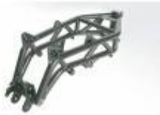
112.223.52 TELAIO ANTERIORE MIDI RRZ-3 CON CUSCINETTI STERZO