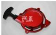
115.017.05 CARTER AVVIAMENTO CNC RACING PLK PER MOTORE BZM-IAME