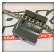
112.486.30 SMAGLIATORE PER CATENA