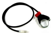
112.340.00 PULSANTE STOP STANDARD