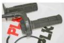
112.327.14 COMANDO GAS RAPIDO PLK CON FILO CARBURATORE SH 14